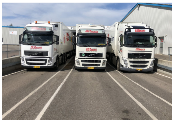
Vores 3 lastbiler, som kører varer ud fra Central lageret til butikkerne. De store kundevoogne til de store indkøb. Ungarbejdere i ABC i højt humør.

et stykke ude i fremtiden, inden det kan lykkes. Det er i Esbjerg og Ringkøbing, der måske kan blive en mulighed for nye ABC-butikker. I bedste fald kan den første blive i slutningen af 2023 eller i starten af 2024.